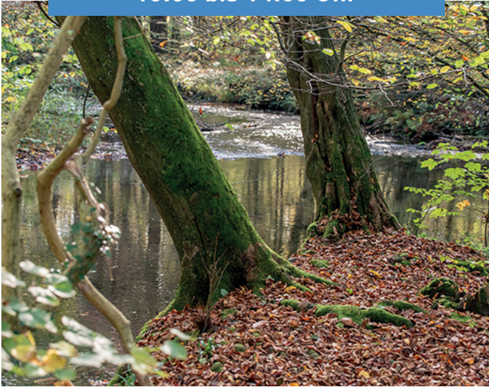
Straußenfarm und Eifgenbachtal

Donnerstag, 20. Juli 2023, 10:00 bis 14:00 Uhr